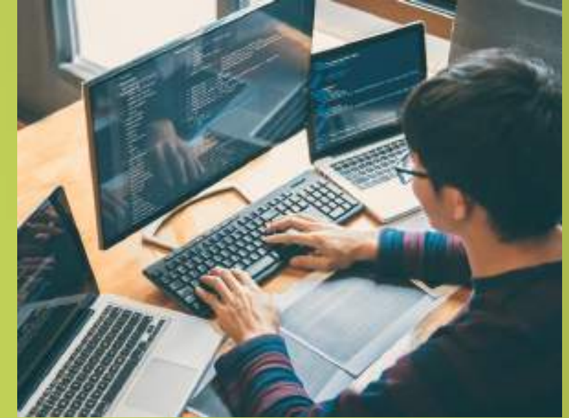
✓ ITICs informática / Programación