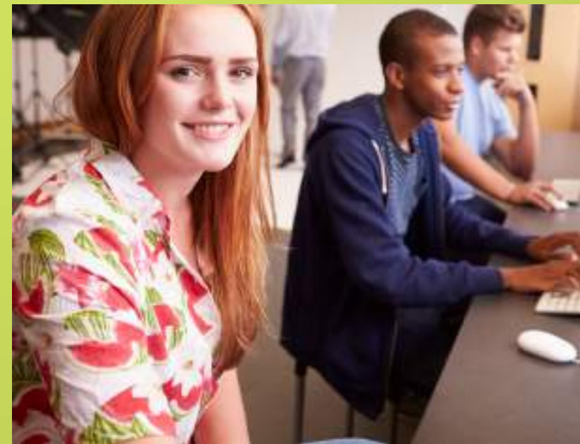
✓ Comercio online