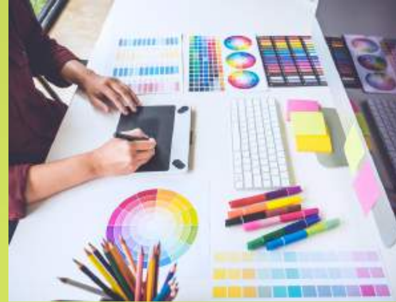
✓ Diseño Gráfico