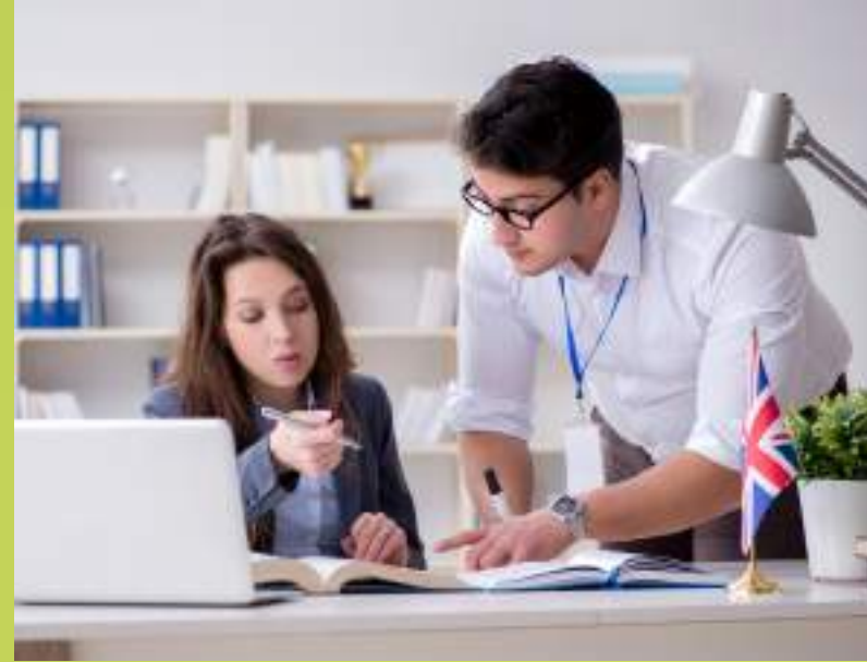
✓ Idiomas extranjeros y traducción