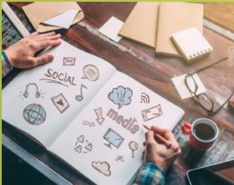
✓ Marketing y comunicación