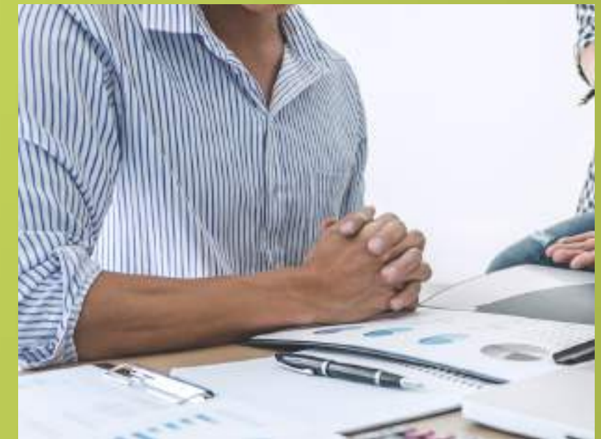
✓ Gestión de Proyectos